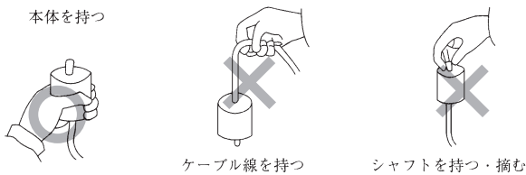
ケーブル線を持つ